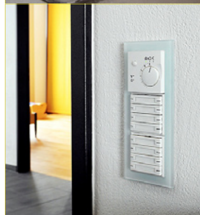
Vielseitiger und ästhetischer – sichtbarer Fortschritt bei der Installationstechnik.