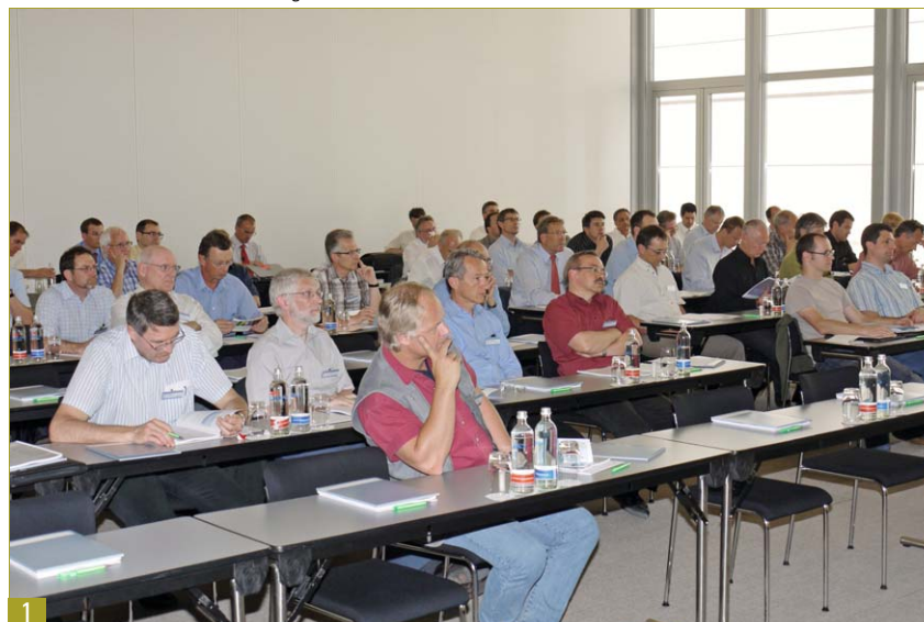
1 Aufmerksame Fachleute am Kundenevent von Siemens Building Automation zum Thema Gebäudeautomation und Energieeffizienz.