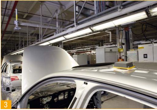
3 RFID-Transponder im Einsatz bei der Audi A6-Fertigung. 4 Kostengünstige Smart-Labels.

Archivieren/Verfolgen (Asset Management) zu finden. RFID-Tags vereinfachen die Steuerung von Produktion und Materialfluss, optimieren Logistikprozesse und ermöglichen die umfassende Rückverfolgung von Produkten. Die kostengünstigsten Transponder, sogenannte Smart-Labels, werden auf einer Trägerfolie aufgebaut und zum Teil in Papieretiketten eingebracht. Diese Labels eignen sich vor allem für Einmalanwendungen in der Logistik, wo sie zum Beispiel auf einer Versandeinheit aufgeklebt werden. Der Nachteil: Die Labels sind vergleichsweise empfindlich gegen Umweltbedingungen wie Temperatur und Feuchtigkeit oder mechanische Beanspruchungen. Ungleich robuster sind hingegen die industrietauglichen Transponder. Durch ein stabiles Gehäuse